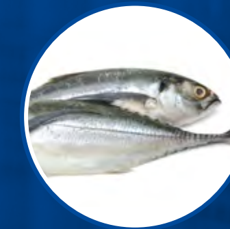
CHICHARRO HORSE MACKEREL TRACHURUS SPSP