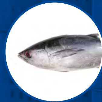
BONITO DEL NORTE ALBACORE TUNNUS ALALUNGA