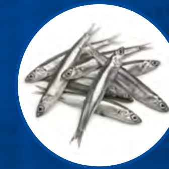
ANCHOA DEL CANTÁBRICO ANCHOVY ENGRAULIS ENCRASICOLUS