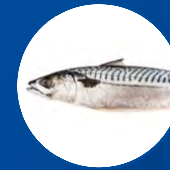
VERDEL MACKEREL SCOMBER SCOMBRUS