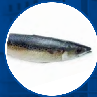
MACAREL ATLANTIC CHUB MACKEREL SCOMBER COLIAS