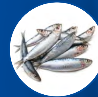
SARDINA SARDINE SARDINA PILCHARTUS